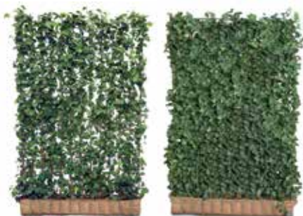
Links die Hecke, wie sie ausgeliefert wird. Rechts gleiche Hecke nach einer Vegetationsperiode.