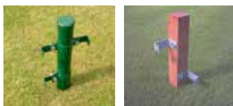
Links Metall-, rechts Holzpfosten mit Bügel